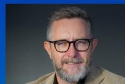
SAÛL GARRETA PRESIDENTE DEL PORT DE TARRAGONA