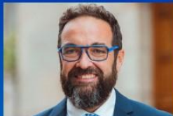
JULI FERNÀNDEZ CONSELLER DE TERRITORI DE LA GENERALITAT