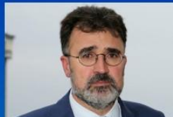
LLUÍS SALVADÓ PRESIDENTE DEL PORT DE BARCELONA