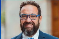
JULI FERNÀNDEZ CONSELLER DE TERRITORI DE LA GENERALITAT