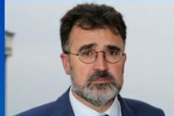
LLUÍS SALVADÓ PRESIDENTE DEL PORT DE BARCELONA